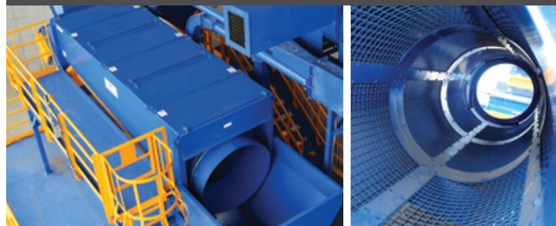
Le crible rotatif pour le traitement des particules fines

Gamme complète d'ouvertures de passes selon l'application