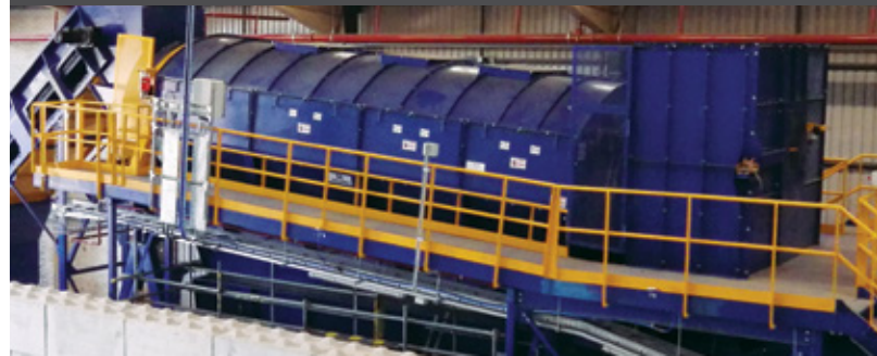
Une passerelle d'accès peut être installée en option