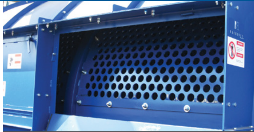
Portes d'accès de chaque côté facilitant l'entretien